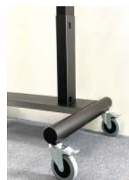
Erikoispyörät + 22,- - 80,-

Pyöräsarja (4 kpl) paripyörät 75 mm Pyöräsarja (4 kpl) 100 mm Huom! Pyöräspecifikaatiot sivulla 12