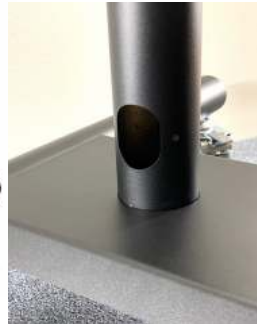
Kaapeliläpivienti 60x40 mm Pylväissä kaapelijohdin