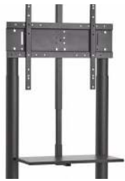
Hyllytaso ja kiinnike 1-3:lle hyllylle

100 mm lukittava pyöräsarja (4kpl) Painonkesto 70 kg/pyörä 40,00